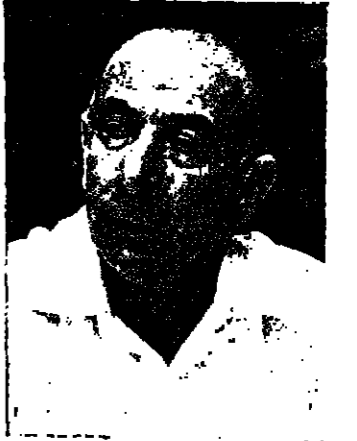
وزير المالية يفتال هوروفيتس